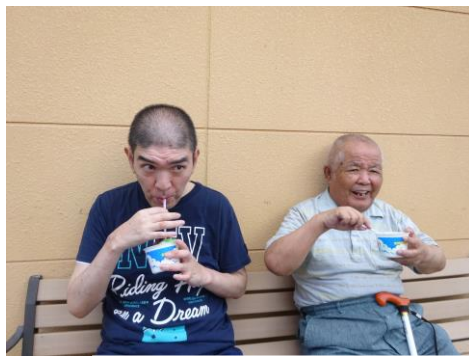
冷たくて頭が痛い！！