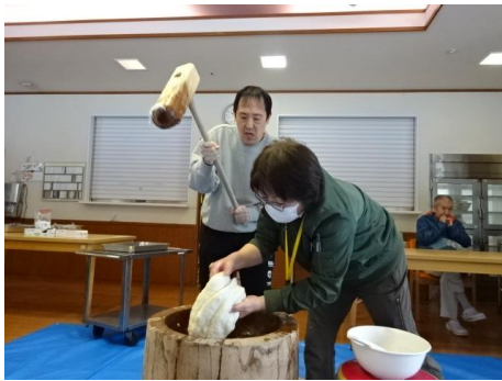
その手つきはやはり 手慣れたもの！！

「よいしょー。」「よいしょー。」 と掛け声をかけ、ご利用者に順番 について頂きました。