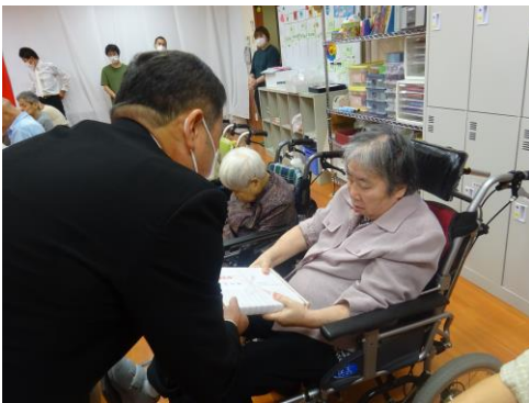
お祝いの記念品を贈呈しました。

令和3年9月12日にききょうの杜 管理棟スペースにて盛大に開催しました。今年も新型コロナウイルスの感染予防の為、密にならないように65歳以上のご利用者だけの参加でしたが、昼食時には他のご利用者と一緒に祝いをしました。ききょうの杜では、65歳以上の高齢者の方が古希(1名)・傘寿(1名)・米寿(1名)を含めて19名の方がおられ、記念品を贈呈しお祝いしました。